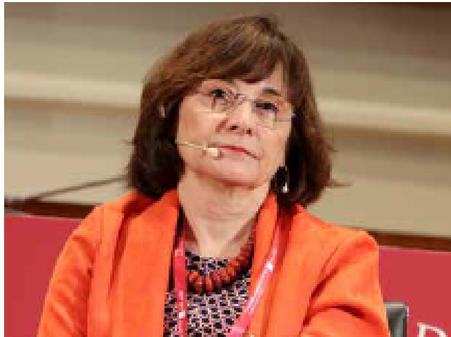
LOURDES ARASTEY Magistrada de la Sala IV (Social) del Tribunal Suprem

La independència del poder judicial, el col·lapse dels jutjats i els sistemes de resolució alternativa al conflicte són els tres temes que, en aquesta ocasió, hem plantejat a les magistrades Lourdes Arastey i Montserrat Raga.